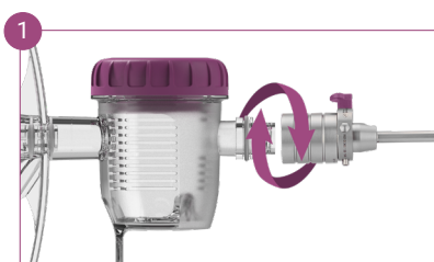
Assemblez ICE à sa chemise interne