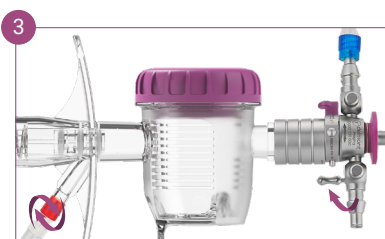
Fermez le robinet et déplacez la tubulure d'aspiration à l'arrière de l'activateur